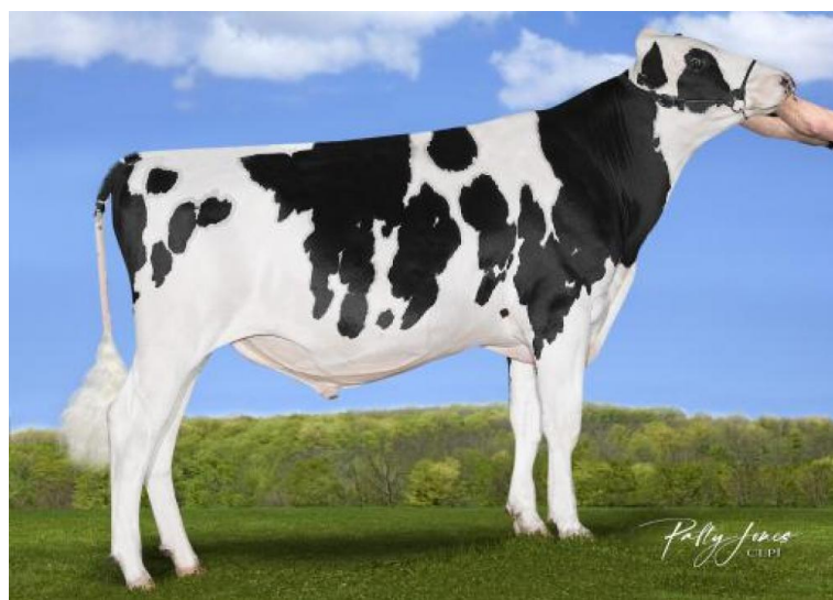
Jook Einstein QUALITY

Quality ist ein Sohn von Silverridge Einstein, der durch seine Töchter imponiert und sich als Bullenvater zunehmend einen Namen macht. In der Mutterlinie stammt Quality aus derselben Familie wie T-Spruce Lionel, was die Vererbungskraft der Familie für hohe Leistungen dokumentiert. Quality präsentiert sich mit 3096 GTPI als hervorragender Allrounder mit sehr hoher Milchleistung bei guten Inhaltsstoffen (plus Beta-Kasein A2/A2 und Kappa-Kasein BB), einer hervorragenden Eutergesundheit, Töchterfruchtbarkeit und Nutzungsdauer sowie leichten Geburten. Die Töchter sind durchschnittlich in der Größe, haben eine offene Rippe, breite Becken und sehr gute Fundamente. Die hoch aufgehängten Euter haben ein sehr festes Zentralband und längere, mittig platzierte Striche. Mit zusätzlichen Töchtern in Milch verzeichnet Quality einen weiteren Anstieg seiner Zuchtwerte und gewinnt an Bedeutung für die Züchter profitabler Laufstallkühe.